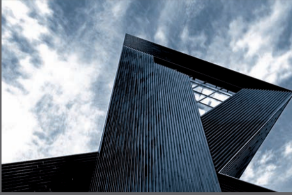
Neue Synagoge, Mainz