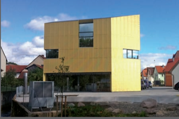
BV Bäckerei, Litzendorf