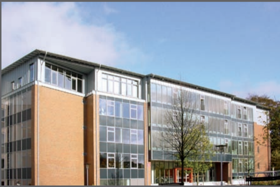
Gymnasium, Ulricianum Aurich