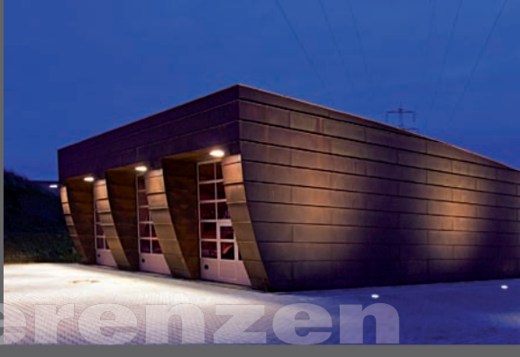
Feuerwehr Rossmart, Altena