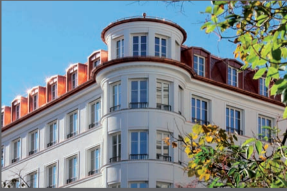
Isartor Palais, München